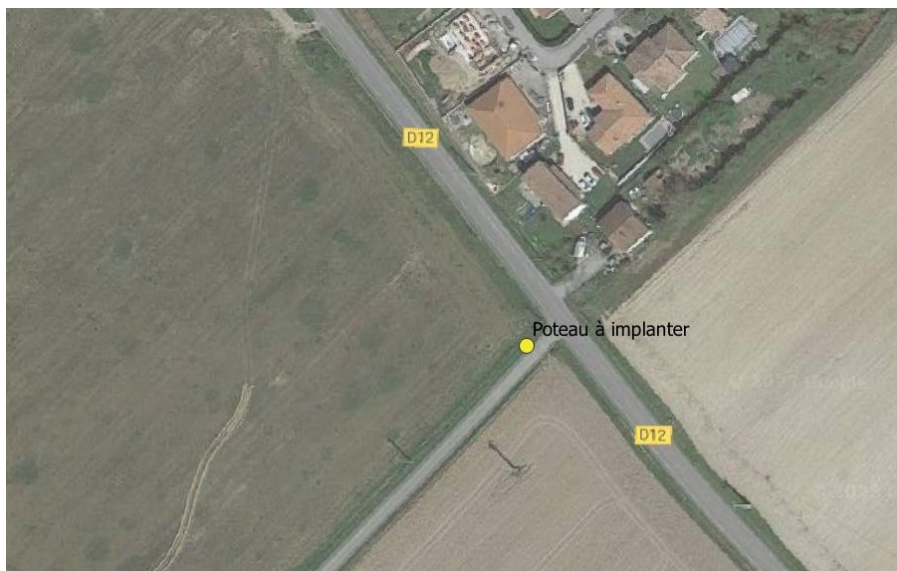
Poteau Bois n°6