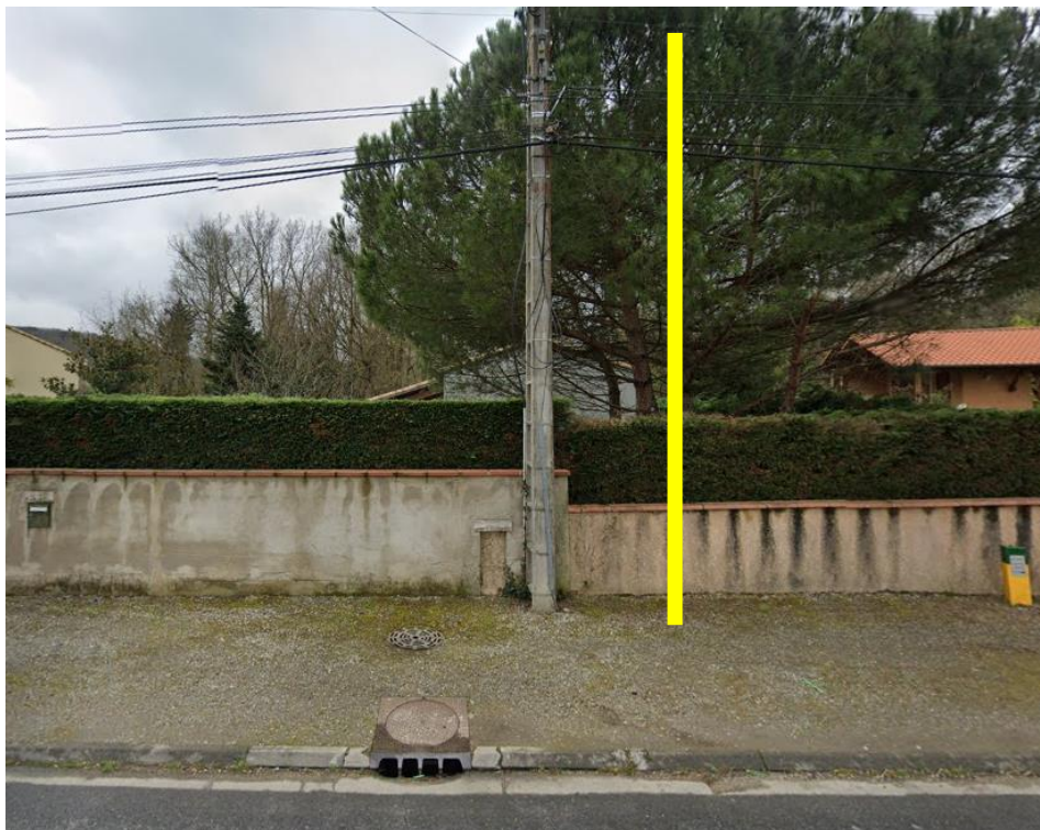
Pose d'un Poteau bois 7m