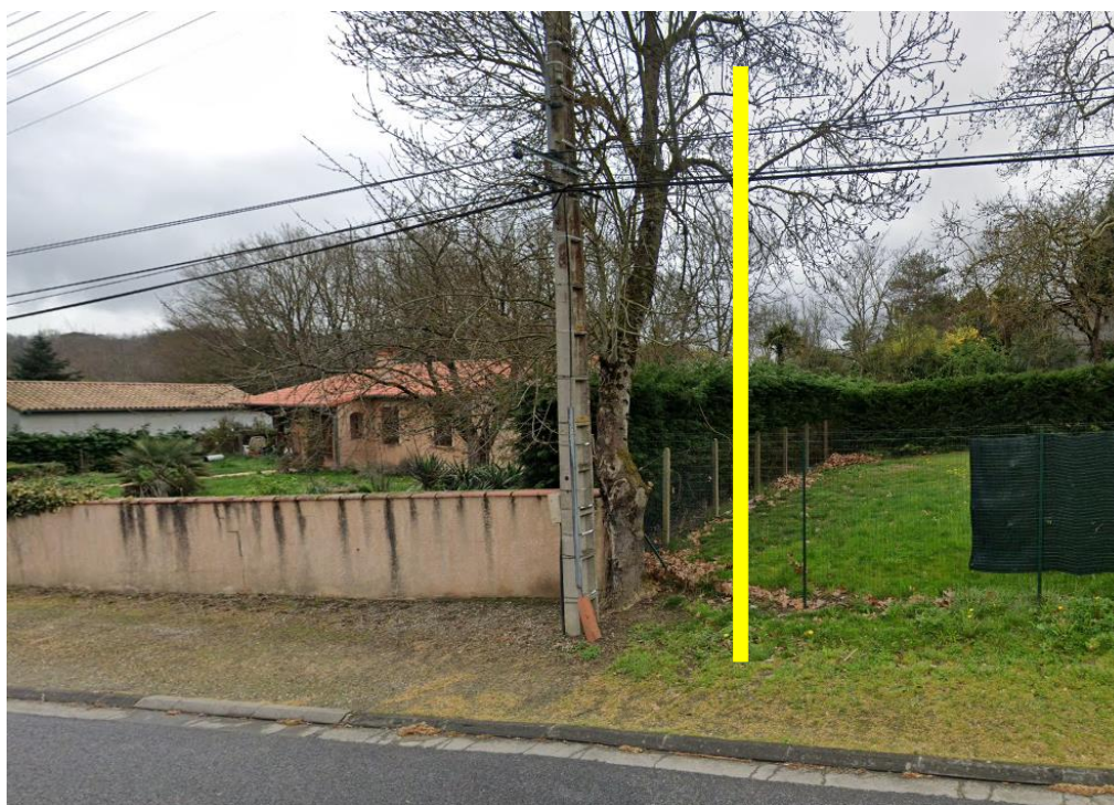
Pose d'un Poteau bois 7m