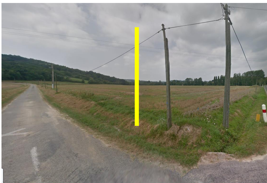
Pose d'un Poteau bois 7m