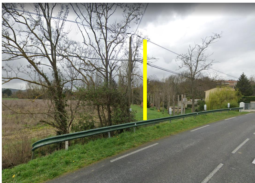
Pose d'un Poteau bois 7m