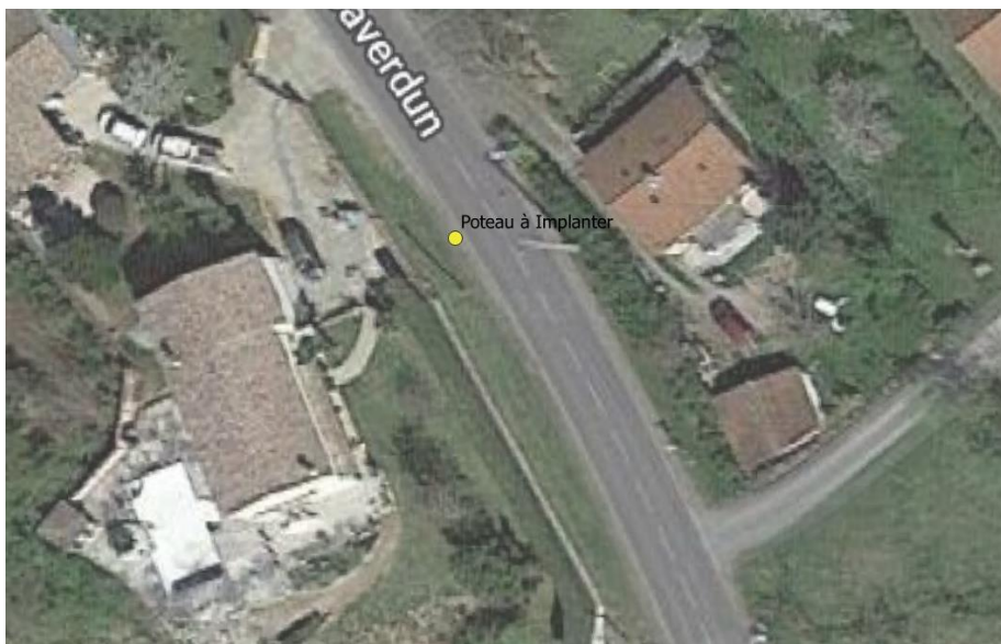
Poteau Bois n°4