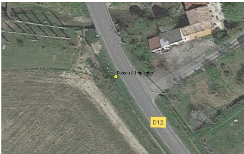
Poteau Bois n°5