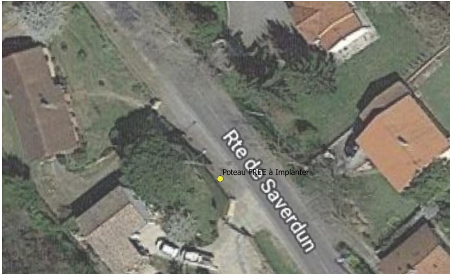
Poteau Bois n°3