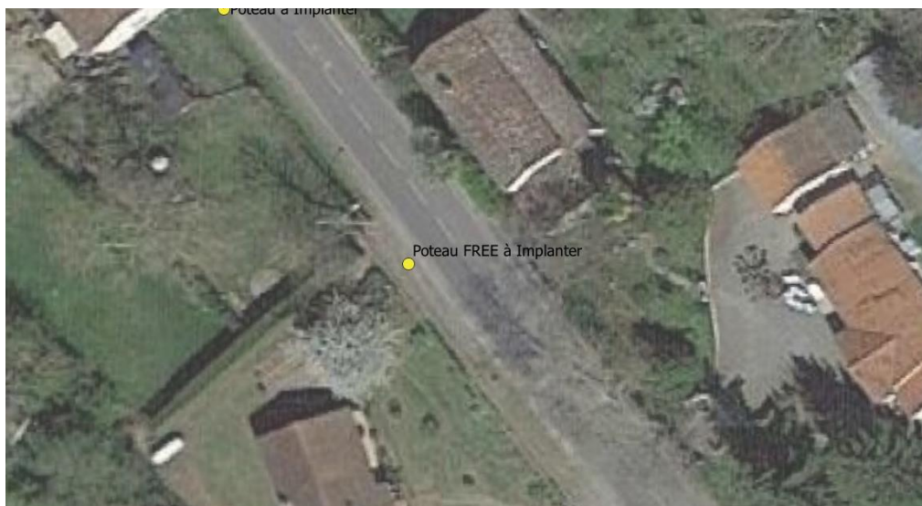
Poteau Bois n°2