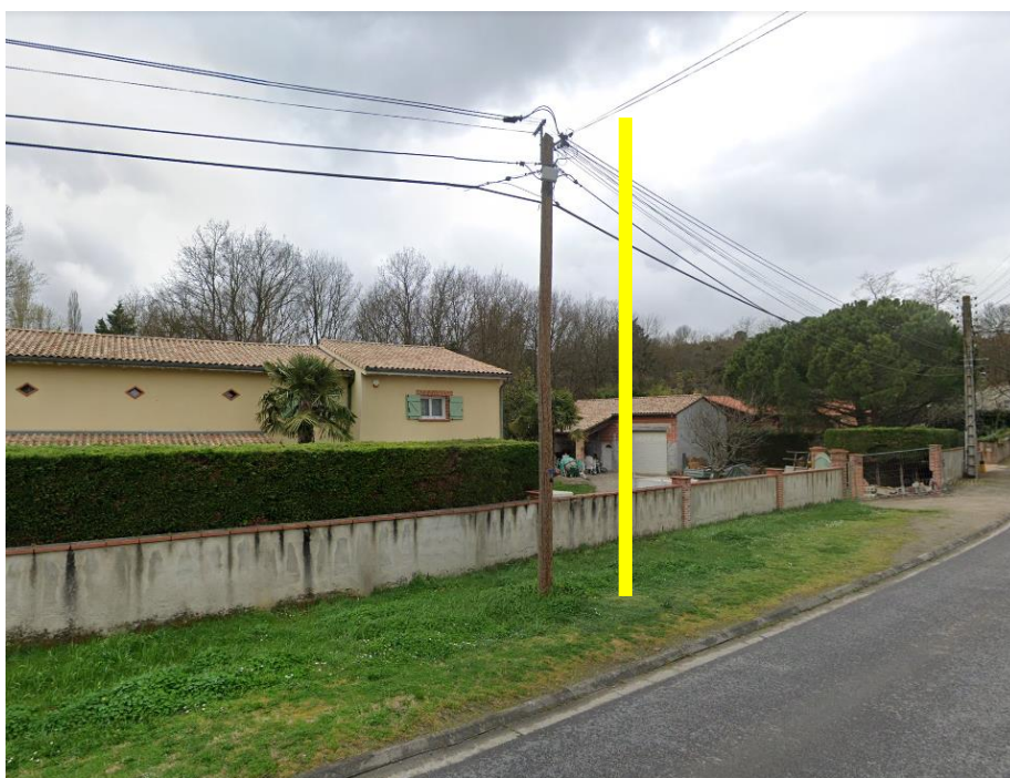
Pose d'un Poteau bois 7m