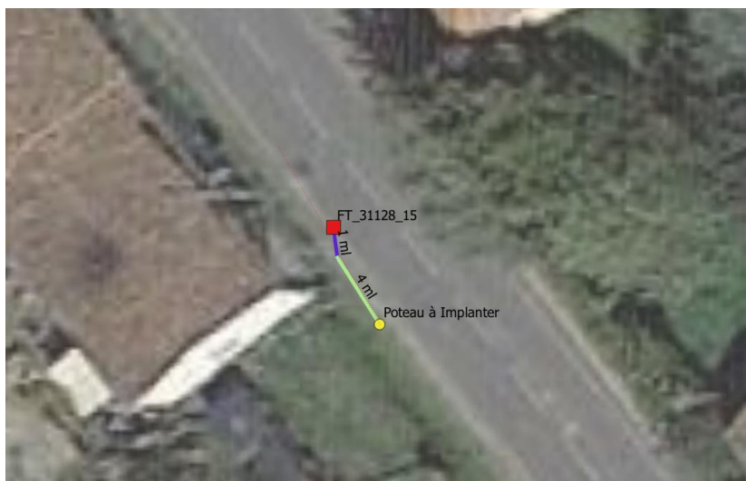
Poteau Bois n°1