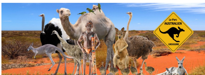
Le Parc Australien