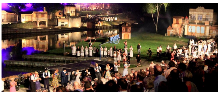
Au fil de l'eau une histoire