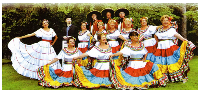
Les amis de la chanson